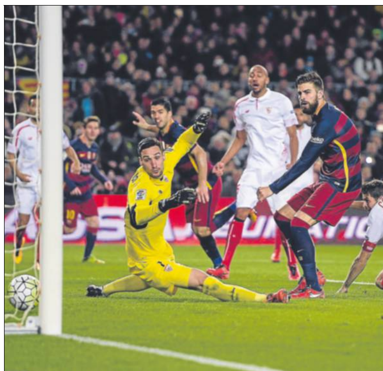
Gerard Piqué, decisivo. Cazó en el área pequeña un pase de Suárez y metió el 2-1.

Con más rotaciones de la cuenta y ante ese Sevilla tan competi-