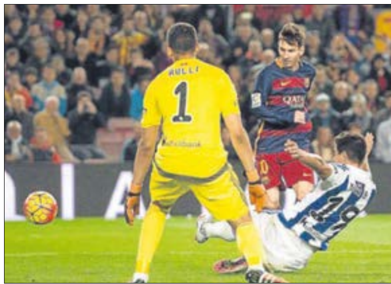
Messi persistió Aunque jugó a medio gas, buscó el gol hasta que lo marcó

El '11' azulgrana sigue 'on fire'. Marcó dos goles, uno a centro de Alves y otro a centro de Mathieu, lateral para dar descanso a Alba, y dio el de Leo después de una preciosa combinación con Suárez. Neymar, pletórico, fue el encargado de acelerar cuando fue necesario para desbordar a la Real, que había salido a presionar a los peloteros del Barça por todo el campo y a dificultarles la salida de balón. Y sin reparar en coces cuando perdían la posición.