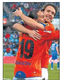
El Espanyol ganó en Getafe

↳ Otro fin de semana con el Espanyol rayando a gran nivel. Su remontada en el campo del Getafe confirma que su trabajo coherente está dando los frutos deseados. Junto con el Barça y el Villarreal, el conjunto de Mauricio Pochettino y el Espanyol es muy fiable, como los otros dos y cada uno con su estilo. En cambio, Valencia y Atlético siguen con los altibajos conocidos. El Espanyol casi siempre juega a lo mismo y eso suele dar resultados pero también despierta el interés del