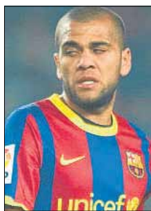
Alves sigue sin renovar

↳ El 'caso Alves' está llenando muchas páginas en los diarios y ocupando muchos minutos en radios y teles. Personalmente, creo que por el potencial que tiene, es normal que un jugador de ese nivel pida estar entre los grandes a nivel de reconocimiento salarial. Sin embargo, también hay que reconocer que en el mundo del fútbol siempre le toca a alguien pagar los errores del pasado y si alguien dio más el brazo que la manga subiendo las fichas, ahora el horno no está para