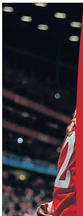
Delirio entre los jugadores de