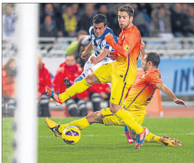
La Real Sociedad volvió a remontar ante el Barça

Messi y Pedro marcaron y ambos también estrellaron un balón al palo