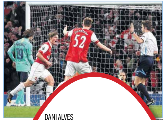
Valdés vio cómo

“No pensemos que porque atacan bien, no saben defender. Vienen con ventaja y no son tontos, querrán mantenerla y aprovecharla. Tienen jugadores de ataque, pero saben defender y no nos van a regalar la pelota. Por jerarquía, por la manera de pensar de su entrenador y por su historia, el Arsenal quiere atacar, pero está claro que vendrá a hacer su partido”, expresó el jugador blaugrana. ■