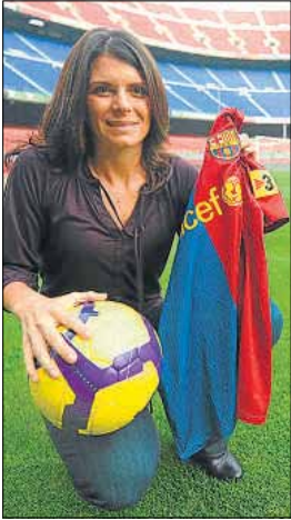
Mia Hamm, embajadora del Barça